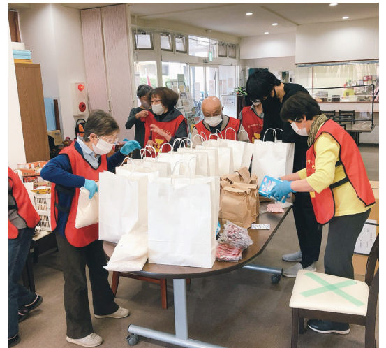
利用者にお渡しするようにボランティアさんによって袋詰めしています

2022年4月から9月迄の半年間で延べ1,316名の利用がありました。2021年4月から2022年3月迄は2,195人で、この半年間で昨年の約1.2倍の利用です。今後更に問い合わせが予測されます。